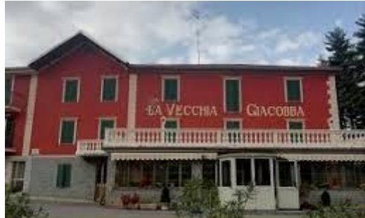
Montaldo di Mondovì ristorante La Vecchia Giacobba