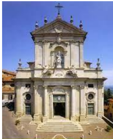
Mondovì (Cn) Cattedrale di San Donato